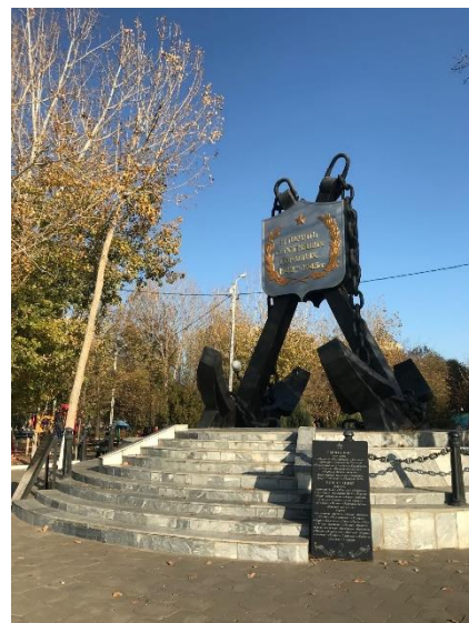
Фотография 2: Памятник погибшим кораблям