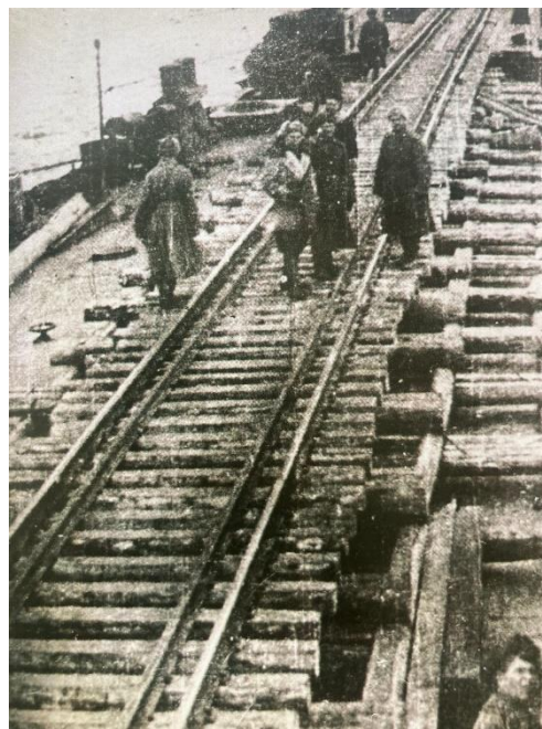
Фотография 1: Строительство моста через Волгу (старого)

В декабре 1942 г. для обеспечения непрерывной подачи боевой техники, боеприпасов, продовольствия в короткий срок была сооружена дерево-ледяная переправа через реку Волга. Такая необходимость возникла из-за осложнения работы паромной переправы, так как с наступлением морозов и утолщением льда на реке ее действие прекратилось.