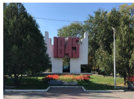
Фотография 3: Памятник Победы в Великой Отечественной войне