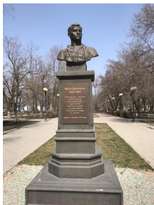
Фотография 8: Памятник М. Джалилю

Но в нашем городе есть много улиц, бульваров и парков, названия которых связаны с Великой Отечественной войной, носит имена героев, которые приближали долгожданную Победу. Давайте их вспомним (улица Степана Здоровцева, улица Зои Космодемьянской, улица Бориса Алексея, улица 28-ой армии, Бульвар Победы, Братский сад). А Мусе Джалилю, советскому поэту и журналисту, Герою Советского Союза, установлен памятник в парке АГУ.