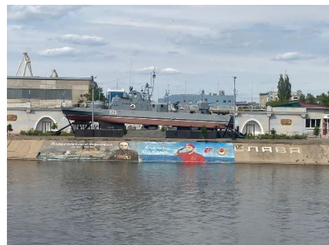
Фотография 9: Памятник воинской доблести русских моряков