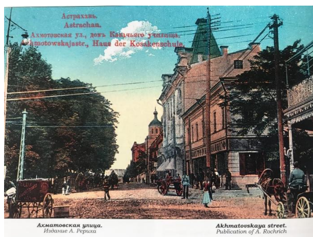
Фотография 11: Ахматовская улица

А заканчиваем нашу экскурсию мы около музея боевой Славы. В этом здании до революции располагалось правление Астраханского казачьего войска и казачий пансион, а летом 1942 года - военный совет 28-ой армии, которая героически защищала наш город на южных рубежах. Сейчас это филиал Астраханского историко-культурного музея-заповедника, здесь размещена экспозиция музея боевой Славы, которую сейчас мы с вами и посетим.