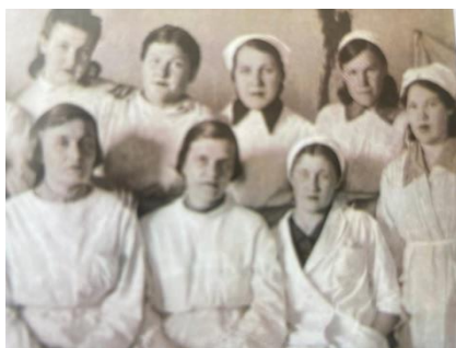
Фотография 4: Мед. Персонал эвакогоспиталя №5472